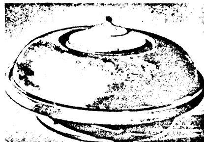
Schaubergers modell av "flygande tefat".

Den knepiga frågan med att hitta ett passande engelskt namn på föreningen avgjordes också under mötet, som enade sig om Swedish Society for the Public Promotion of Scientific Method.